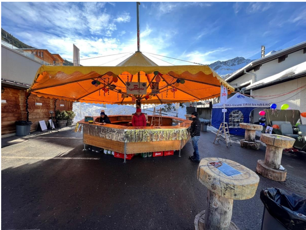
Bild: Tschuetta Bar, 18. Februar 2023