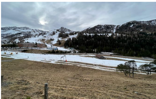
Bild: Schneeflucht 02.Januar 2023

Quelle Liechtensteiner Vaterland 10. Mai 2022 sowie Messwerte der Bergbahnen Malbun AG