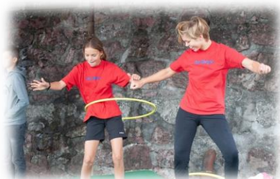
Foto von der ersten Beach-Party im 2015 – Dieses Jahr war das Wetter leider nicht so traumhaft!!