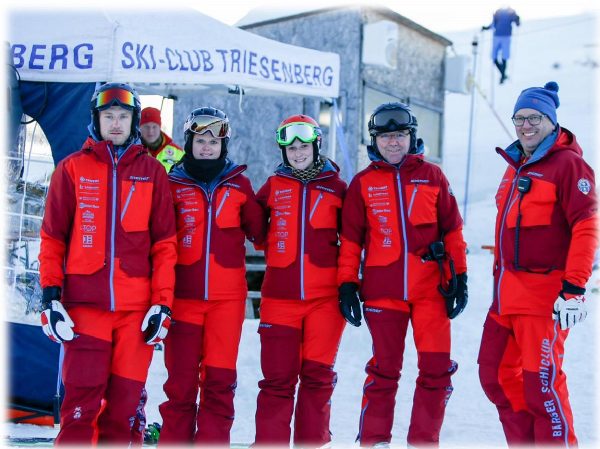
Die neuen Anzüge sehen super aus in der Gruppe

Termingerecht konnten wir unsere neuen Skianzüge, aus dem Teamwear Programm der Marke Ziener, entgegen nehmen. Die Funktionsbekleidung hat sich draussen im Schnee und auf den Pisten bewährt und fand sehr guten Anklang. Vielen Dank an unsere Vorstandsfrauen, welche eine sehr gute Wahl getroffen haben. Auch möchte ich mich bei der Firma Architektur PITBAU Anstalt bedanken, die uns beim Designen unterstützt hat.