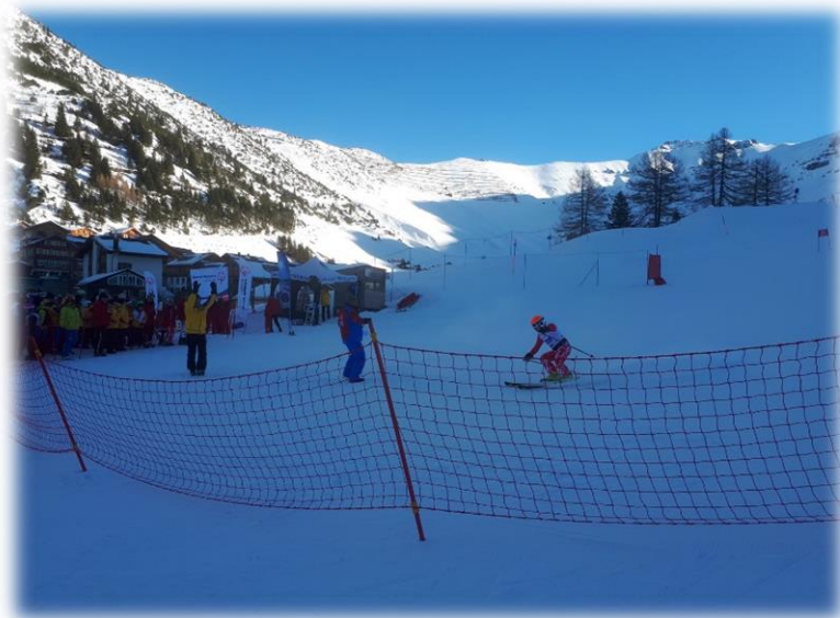
Voller Einsatz bis zum Schluss

Vom 13.-14. Januar 2018 waren Malbun und Steg die Austragungsorte für 190 Special Olympics Ski- und Langläufer aus Belgien, Niederlande, Luxemburg, Österreich, Südtirol, Schweiz und Liechtenstein. Die Skirennen in Malbun wurden auch heuer wieder vom Skiclub Triesenberg durchgeführt. Die Rennläuferinnen und Rennläufer, ihre Trainer und Betreuerinnen, wie auch die Organisatoren waren sehr zufrieden und voll des Lobes. Wir können auf eine langjährige Partnerschaft mit den Special Olympics Liechtenstein zurückblicken.