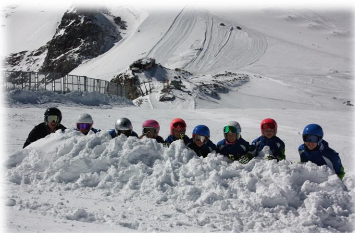
Verstecken vor den Paparazzi