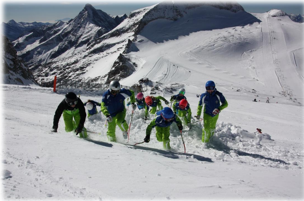
Wer zuerst oben ist!