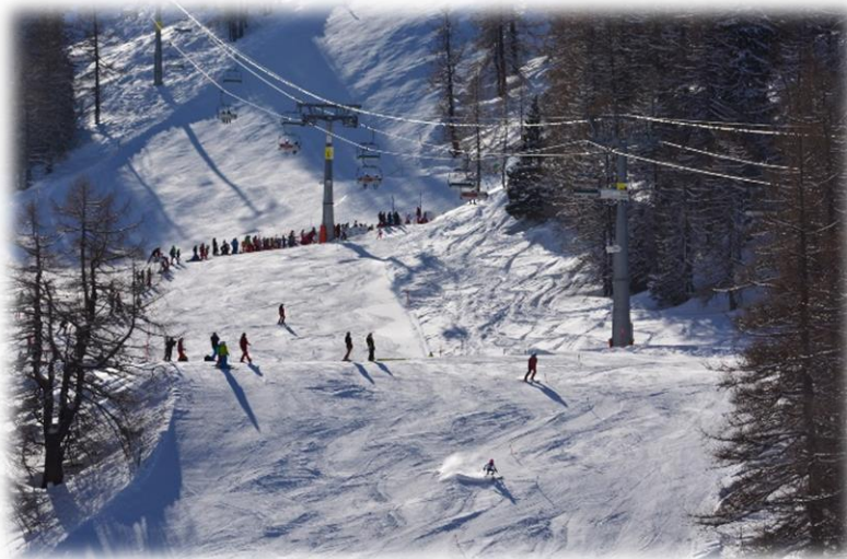
Traum Wetter auf der Rennpiste