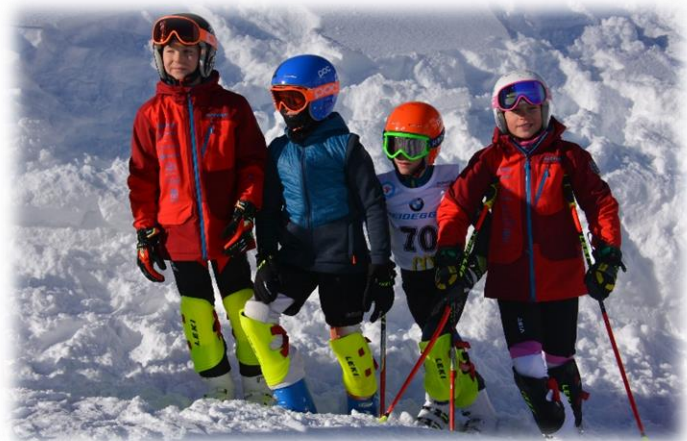
Schauen, wo die Konkurrenz die Linie zieht

Neben dem Brillen-Feder Cup, dem Heidegger-Talentecup, dem LGT-Talentecup, Malbunertrophy und dem Häsi-Race, welche im Malbun stattfanden, fuhr der Skiclub jeweils an die zwei weiteren Fischer-Cup Rennen nach Laax und Madrisa. Da der Riesenslalom in Madrisa leider gleichzeitig wie ein BF-Rennen stattfand gingen wir hier nur mit einer kleinen Gruppe an den Kinderskicross, welcher wegen Nebels leider abgesagt werden musste.