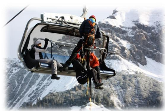
Etwas Mut war schon gefragt bei unseren Clubmitgliedern