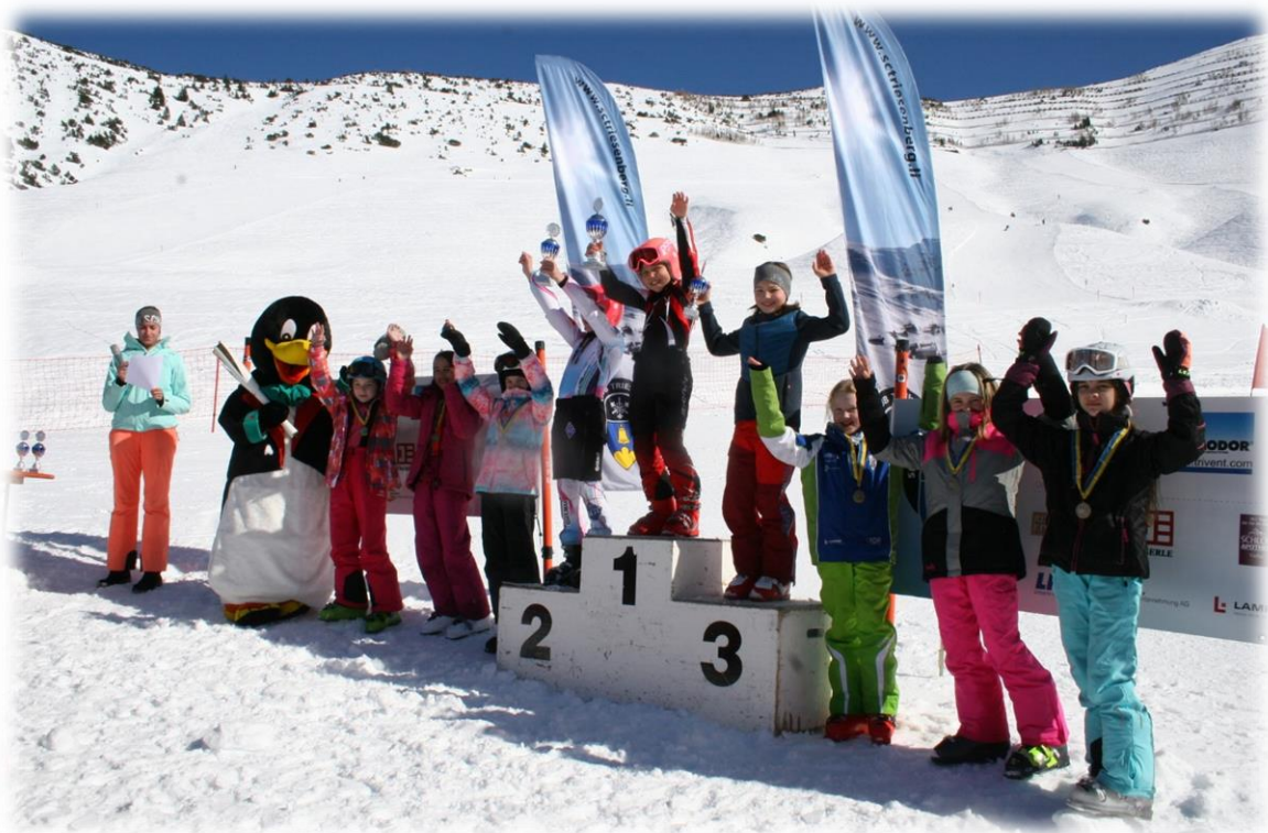
Siegerpose wie die Profis