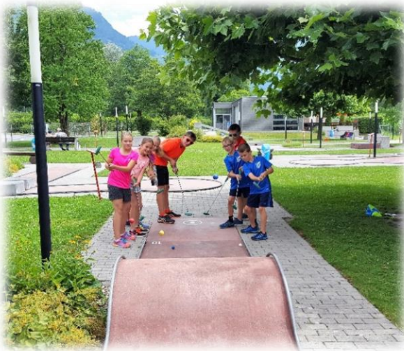
Wer trifft das Loch?