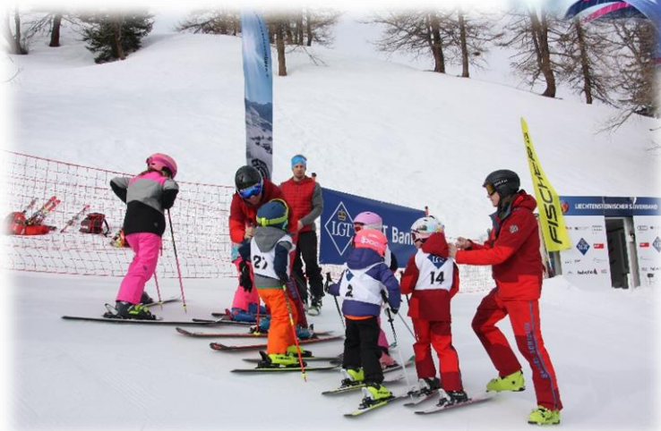
Laufbesichtigung für unsere Kleinsten