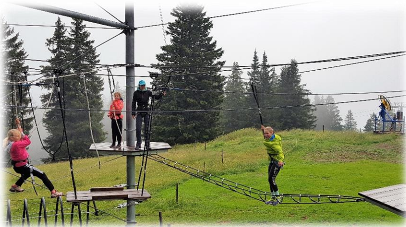
Hoch oben im Kletterpark

Auch diese Saison starteten wir mit unserer Konditionswoche für die Jugendläufer. Gestartet haben wir mit dem jährlichen Duathlon als Vorbereitung für den Brillen-Federer Sommeranlass im Steg. Wie jedes Jahr wurde zuerst mit dem Bike vom Steg bis in die Valüna gefahren und anschliessend bis zur Alpe Waldboda gejoggt. Den Nachmittag verbrachten wir beim Minigolfen in Vaduz. Am Donnerstag stand die Wanderung von Malbun bis zur Pfälzerhütte und zurück an und am Freitag konnten sich unsere Kids im Klettergarten und auf der Rodelbahn in Flumserberg austoben. Den Samstag und Sonntag verbrachten wir wieder zu Hause: Inlinen von Vaduz nach Gamprin mit anschliessendem Baden und am Sonntag führten wir einen 10-Kampf-Wettbewerb durch und am Nachmittag hatten wir viel Spass beim Bubble Football in Rhidamm City. Voll motiviert und mit tollem Einsatz konnten die teilnehmenden 10 Kinder die Trainer begeistern und die Konditionswoche mit einer super Stimmung beenden.