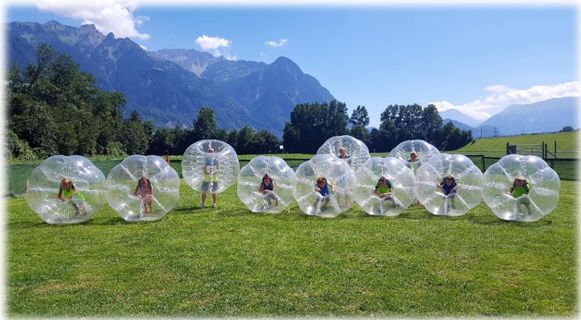
In so einem Bubble Ball landet man immer weich

Am 12. August nahm ein Team von uns an der jährlichen Swiss Ski Summer Trophy in Mels teil. Die Kinder konnten sich bei vielen lustigen Geschicklichkeitsposten im Trockenen und Nassen unter Beweis stellen.