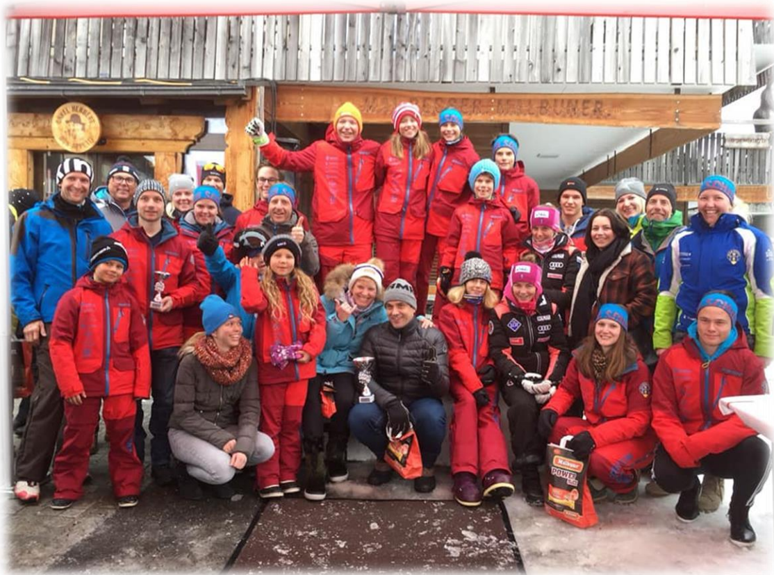
Siegerteam der Malbuntrophy

Somit konnten wir zum zweiten Mal unter Beweis stellen, dass wir Skifahren können!