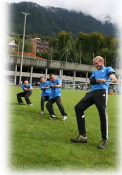
Die Teams wurden in verschiedenen Aufgaben gefordert - wie z.B. Seilziehen