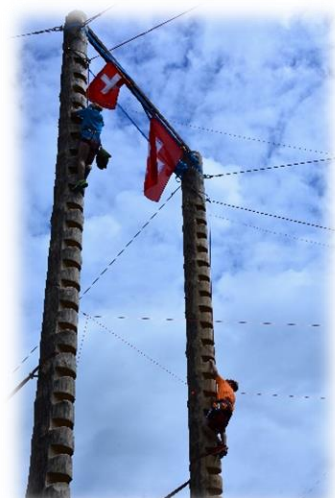
Janik muss ganz hoch

Am 12. August nahm ein Team von uns an der jährlichen Swiss Ski Summer Trophy in Mels teil. Die Kinder konnten sich bei vielen lustigen Geschicklichkeitsposten im Trockenen und Nassen unter Beweis stellen.