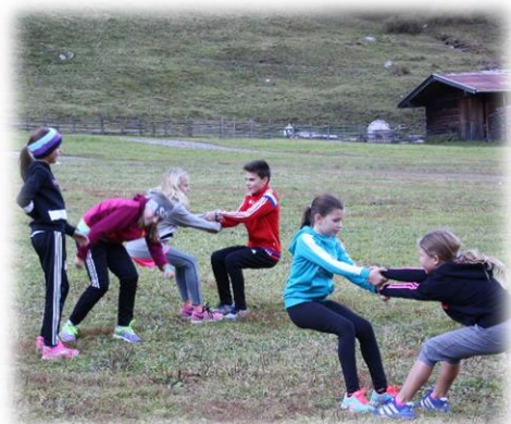
Auch beim Kondi darf der Spass nicht fehlen

Den Kindern und auch den Trainer hat die Woche wieder sehr gefallen, es wurden viele Fortschritte gemacht.