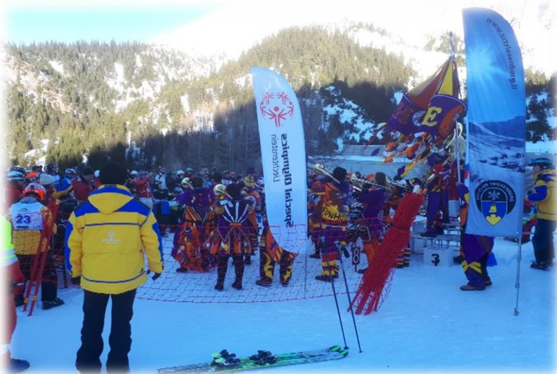
Siegerehrung mit den Triesner Moschtgügler