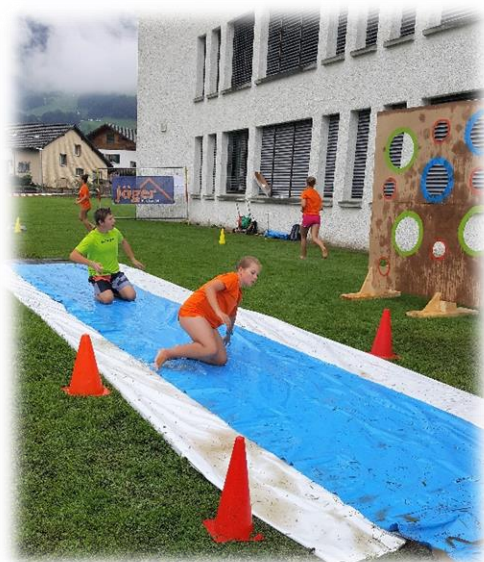
Geschwister Bühler beim Waterslide

Das wöchentliche Konditionstraining jeweils donnerstags im Oberufer startete nach den Sommerferien und zog sich durch den ganzen Winter bis Ende März.