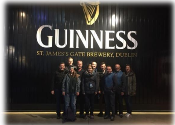
Kompletter Vorstand beim Guinness Storehouse

Auch dieses Jahr nutzten wir das letzte Wochenende im April für den diesjährigen Vorstandsausflug. Die Reise führte uns in die Hauptstadt von Irland, nach Dublin. Mittagessen in der Church, ein Besuch im Guinness Storehouse, Ausflug zur Halbinsel Howth, schlendern durch Strassen der Temple Bar sowie eine Stadtrundfahrt sind nur einige Highlights aus dem vielseitigen Programm.